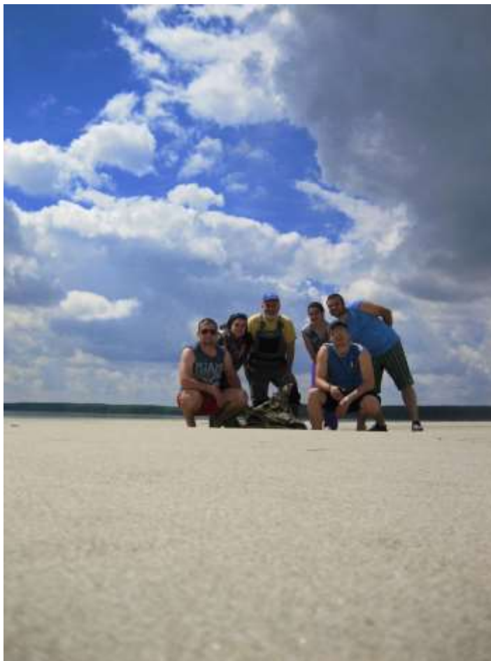
На пясъчния бряг на остров Батин

Подходящи места за палатков лагер са пясъчната плитчина на носа на острова, на 522,5 км и на опашката на 529,5 км.