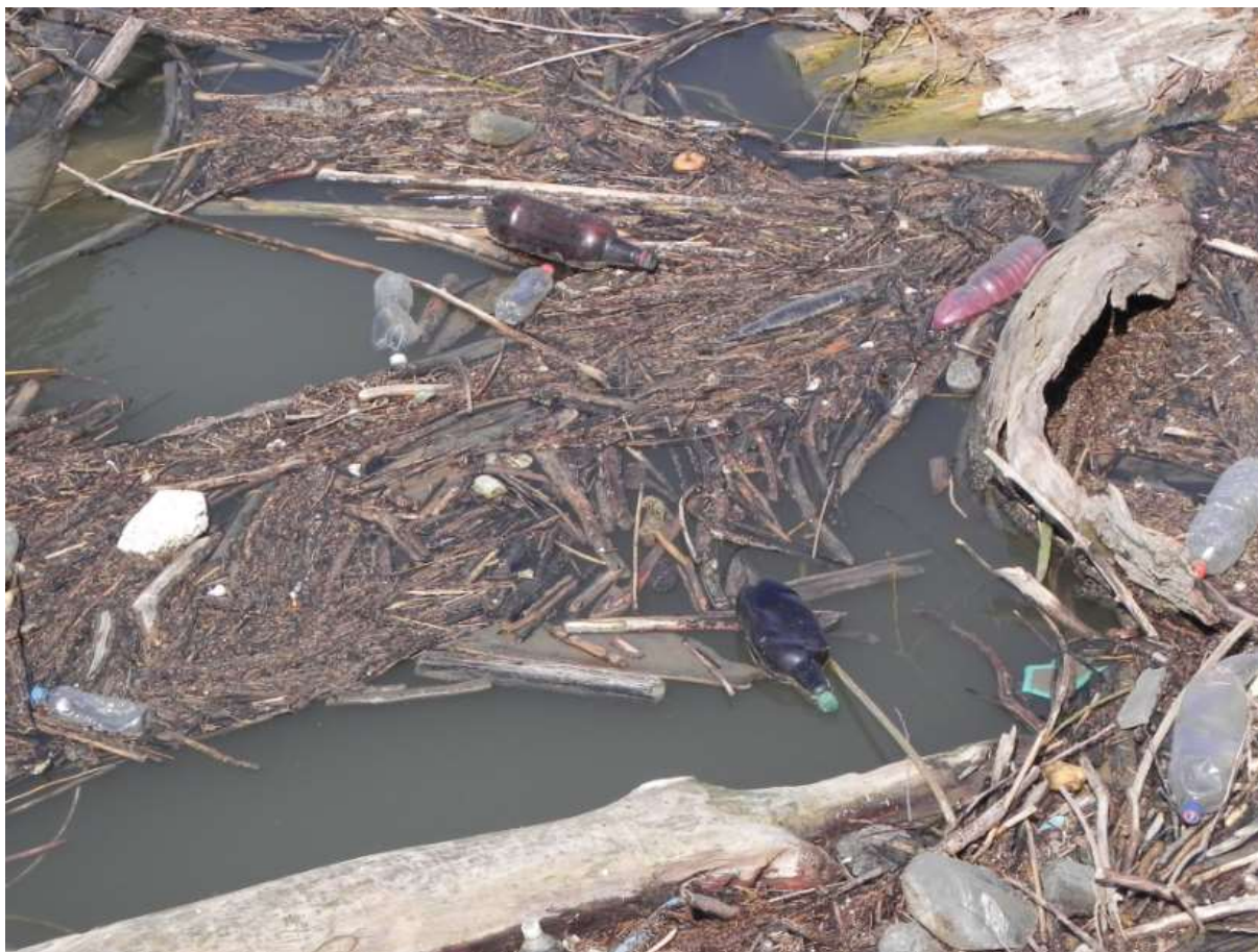
Находище на отпадъци на носа на остров Люляка

Най-замърсен е носът на остров Люляка, на 501-502 км. Там екипът на ТД Приста регистрира няколкокостотин килограма отпадъци – предимно пластмасови шишета.