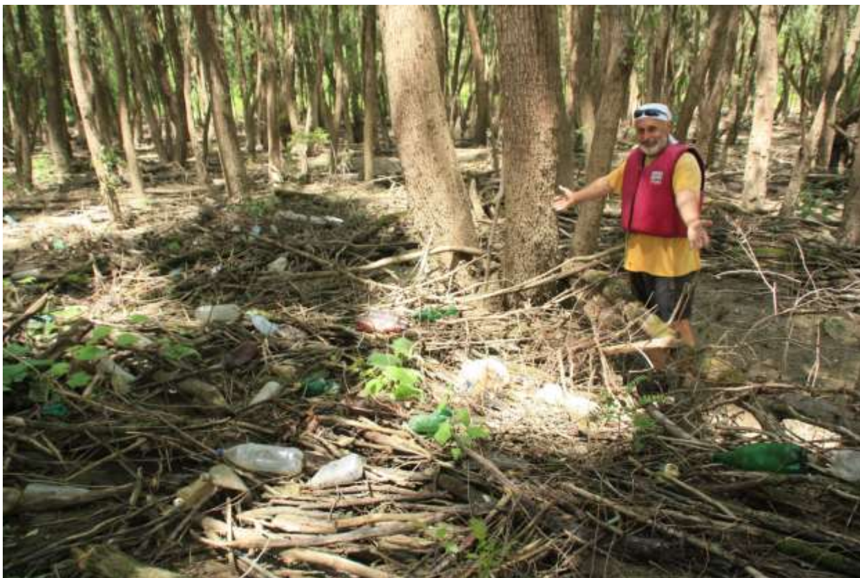
Локализирано находище на отпадъци на 474 км

На 474-тия км на южния бряг на острова екипът на ТД Приста засече сметище, довлечено от реката.