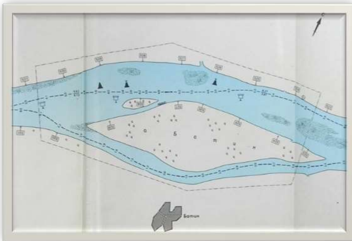
Остров Батин и по-малкия Дойчов остров

Остров Батин се намира срещу село Батин между км 529.3 и км 523, попада изцяло в защитена зона по Натура 2000 Батин с код BG0000232 Защитена зона по Директива за местообитанията , която припокрива Защитена зона по Директива за птиците Рибарници Мечка с код BG0002024. Зоната обхваща целия остров, близкия Дойчов остров (обявен за защитена местност), както и целия бряг на Дунава от всички страни на острова и значителна част по посока на град Русе. Остров Батин попада в територията на Държавно ловно стопанство Дунав, достъпът до него е ограничен и е възможен само след съгласуване с ловното стопанство. В село Батин живеят доста рибари, които могат да предложат обиколка на острова с рибарски лодки, а между самото село и реката има панорамен хълм с чудесни места за палаткуване, близост до чешма, беседки и барбекюта.