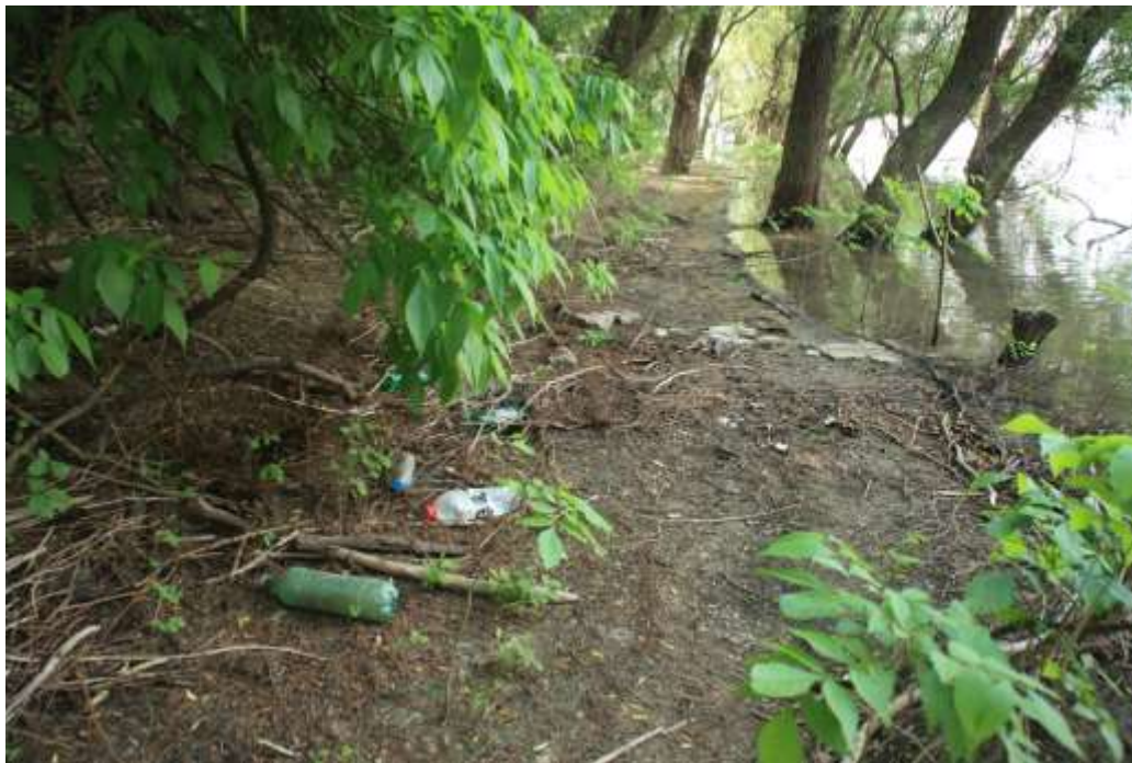
Отпадъци край кът за отдих до село гр. Сливо поле

Поради високото ниво на водата, както и ниските брегове на остров Мишка, пясъчните коси около острова все още бяха под вода през месец май и екипът нямаше възможност да огледа място за лагеруване на самия остров.