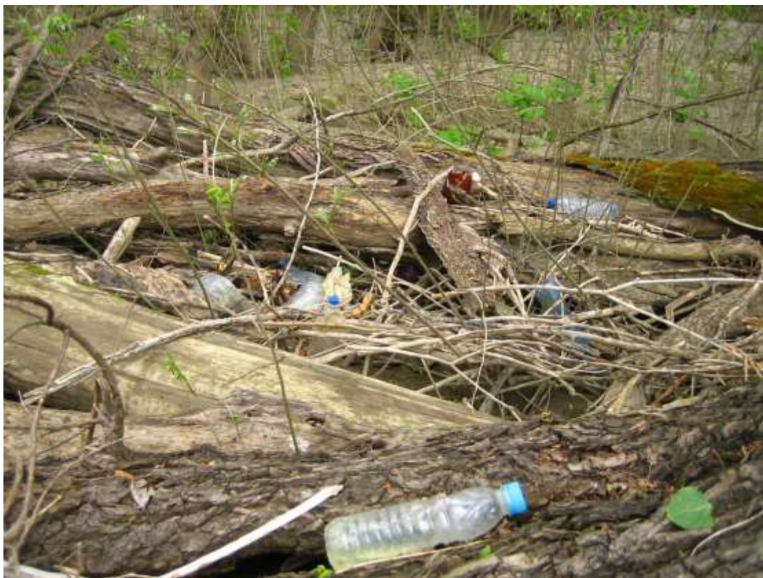
Локализирано находище на отпадъци на остров Батин